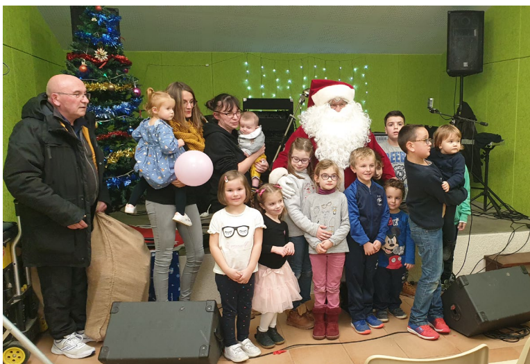
Le Père Noël et les enfants de Belbèze