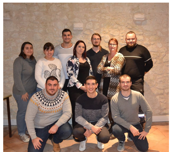
Le Comité des Fêtes