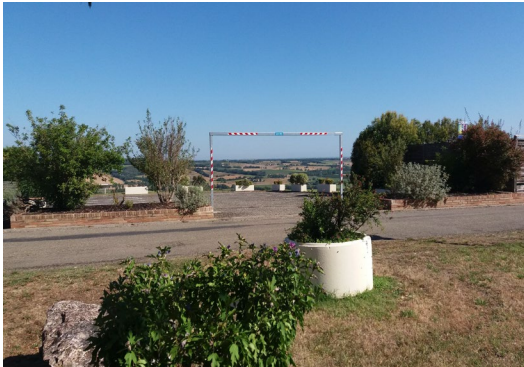
Installation d'un portique de limitation de hauteur.