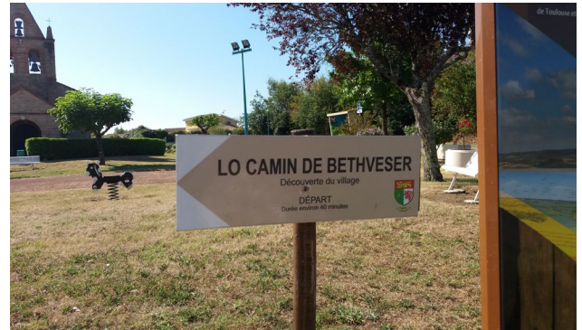
Changement de la signalétique du Camin de Bethveser.